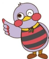
埼玉県マスコット「さいたまっち」

URL http://www.pref.saitama.lg.jp/a0808/rodoseminar/index.html