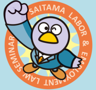
埼玉県マスコット

経験を積んだ従業員ががんや他の疾病で退職することは、企業にとっても大きな損失であり、治療と職業生活の両立支援が求められています。本セミナーでは職場におけるがん・疾病の状況、がん・疾病と就労に関わる課題、治療と職業生活の両立支援のガイドライン、企業の取組事例等について学びます。